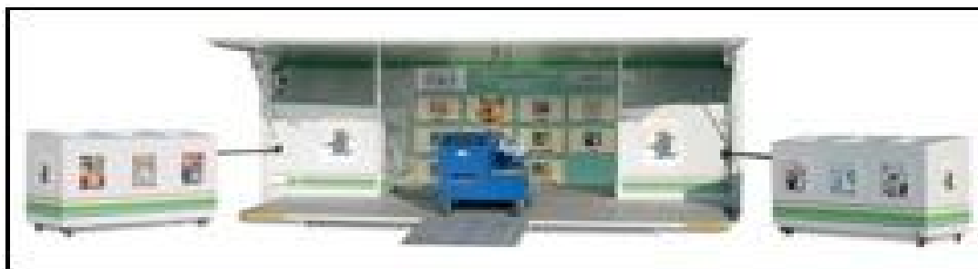
Figura 3 - Esempio di "Ecomobile"

In occasione dei vari appuntamenti estivi e invernali (fiere, feste, eventi sportivi, carnevale, ecc.) potrebbe essere allestito un piccolo spazio per la "Ecomobile" che la Società di gestione del servizio potrebbe mettere a disposizione. Essa servirà per la distribuzione di materiale informativo, rivolto alla popolazione e ai turisti visitatori, riguardante le corrette pratiche per lo smaltimento dei rifiuti, nonché informare sull'utilizzo di stoviglie, posate e bicchieri in materiale compostabile e differenziando tutti gli scarti prodotti. L'Ecomobile, inoltre, è dotata di contenitori dove è possibile da parte dei visitatori di conferire il materiale organico, plastica e vetro.