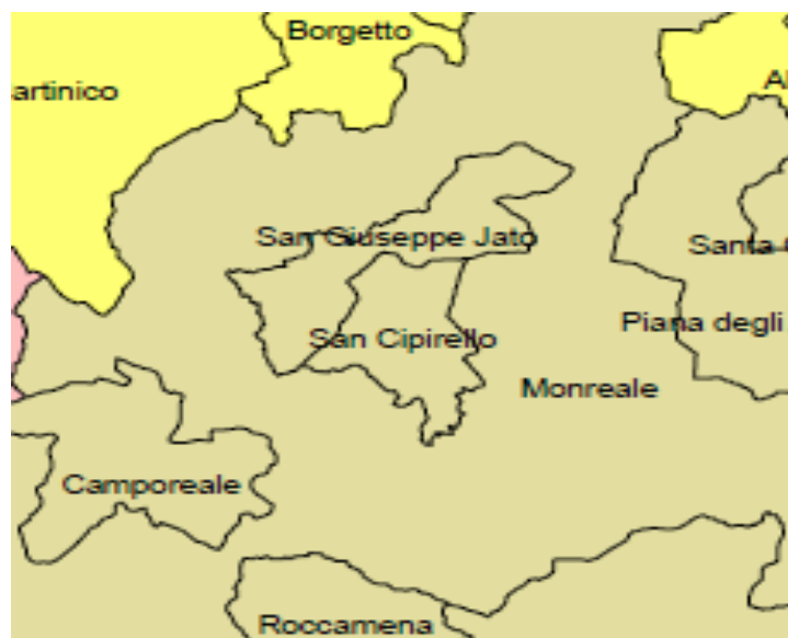
ATO Palermo Ovest e territori di San Cipirello e San Giuseppe Jato

I confini amministrativi dell'ARO, sono quelli con il comune di Monreale.