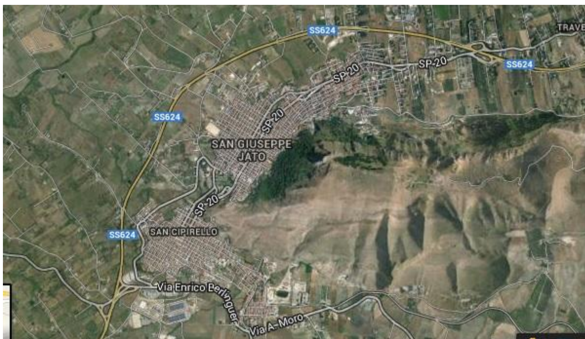
Pano Intervento San Giuseppe Jato-San Cipirello RELAZIONE ILLUSTRATIVA