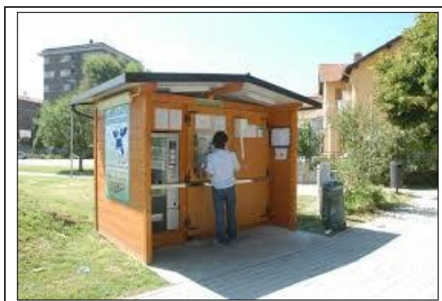
Figura 2 - Esempi di Casa dell'acqua

La casa dell'acqua potrebbe essere posizionata all'interno dei due centri urbani, in punti individuati dalla stazione appaltante.